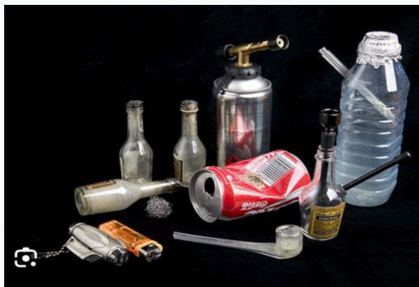
Strumenti impiegati nell'uso di crack