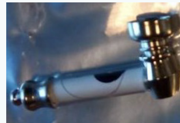
Pipetta per l'uso di crack fornite dall'Unità di Prossimità