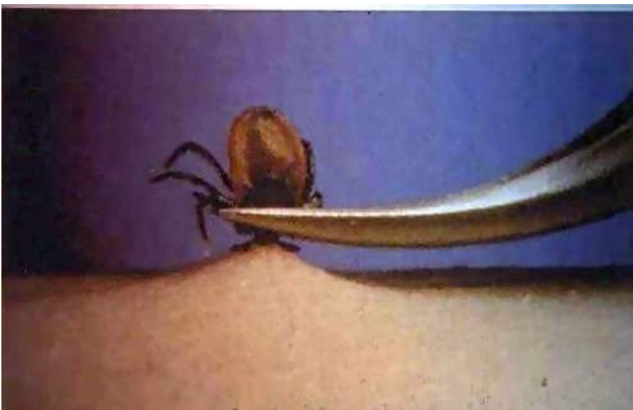
Pinza curva tipo "Klemmer"