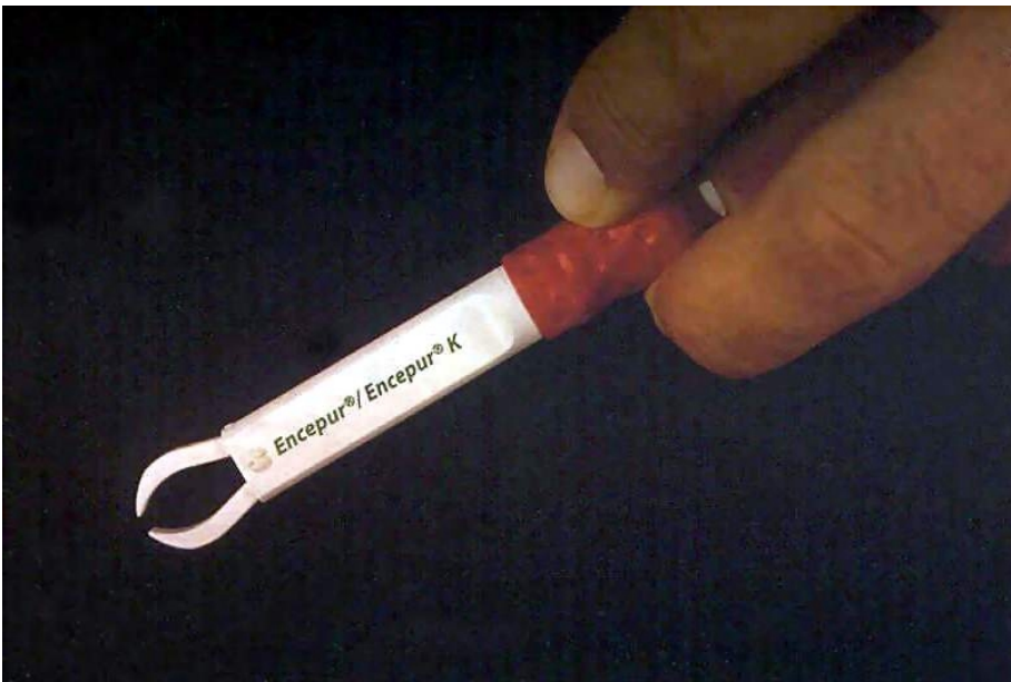
Pinza "a tenaglia"