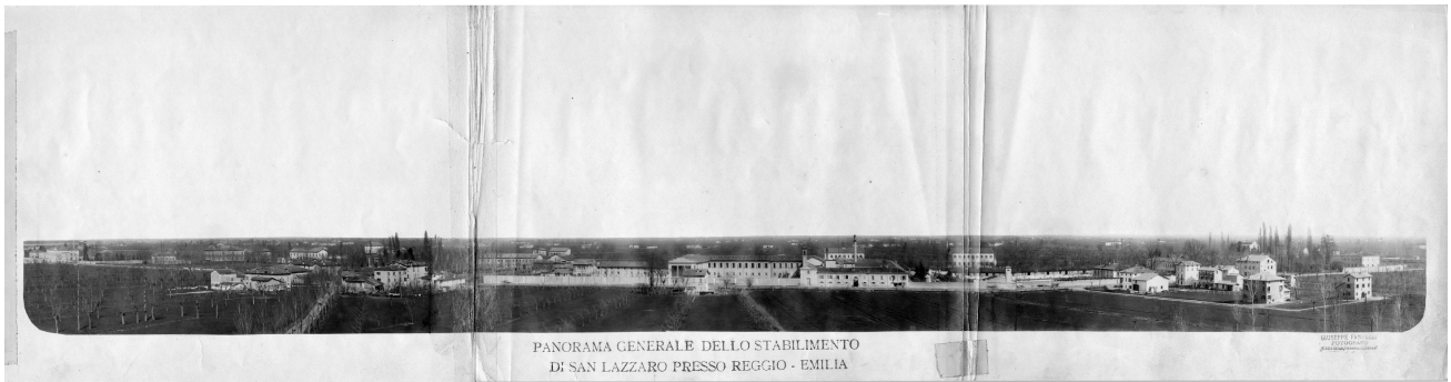
Panorama centrale dello stabilimento di San Lazzaro presso Reggio-Emilia. Giuseppe Fantuzzi, 1910.

Autorità incontro al Ministro: oggi alle 16.30 all'imbocco dell'autostrada: il programma della breve sosta reggiana del Senatore Mariotti, le opere da inaugurare, (1967). Gazzetta di Reggio , 8 luglio. p. 4.