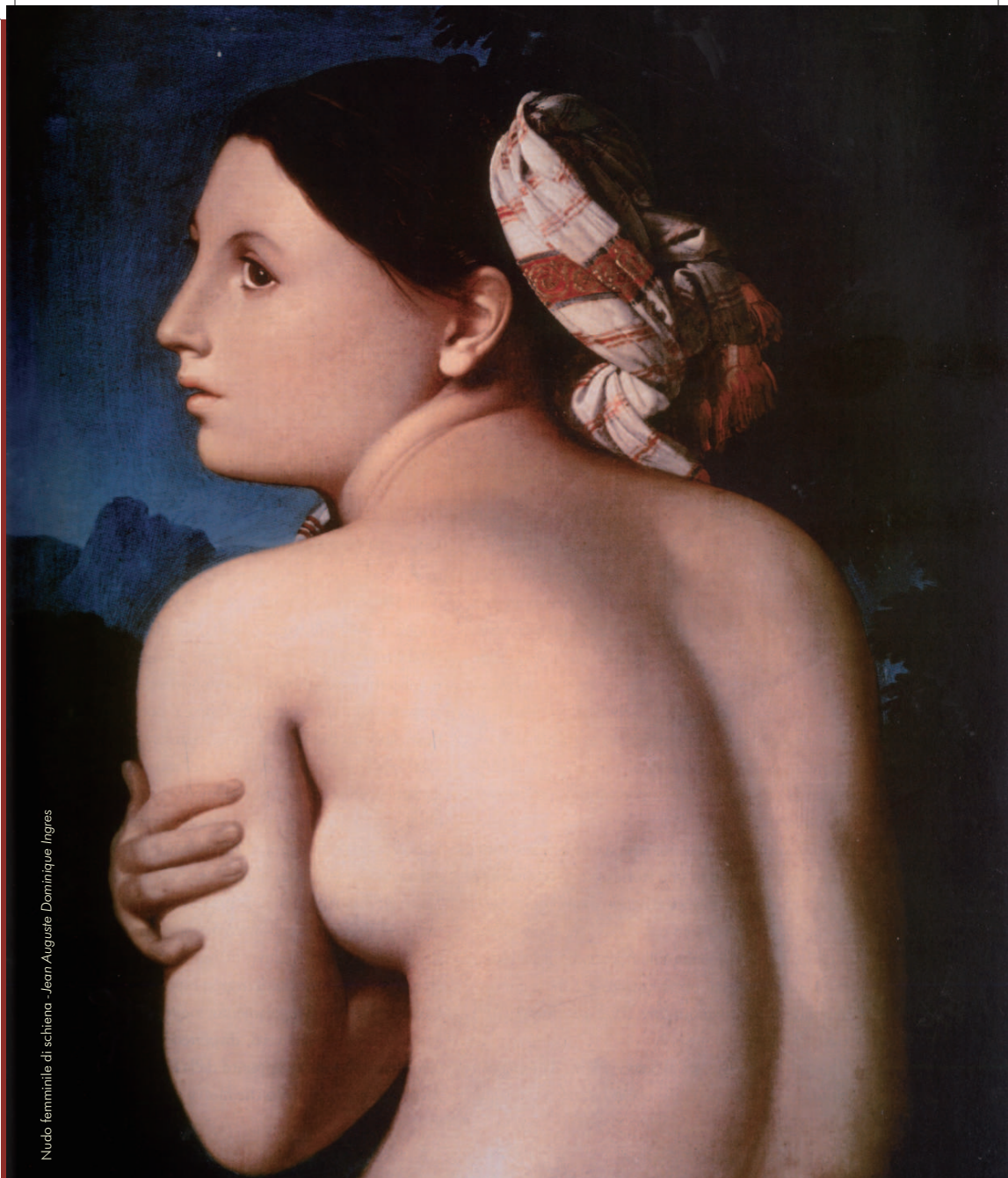
Nudo femminile di schiena - Jean Auguste Dominique Ingres