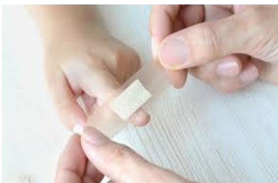
METTE IL CEROTTO