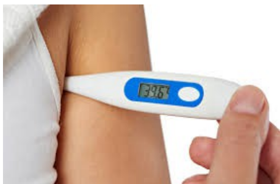
PROVA LA TEMPERATURA