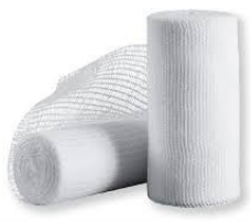
FASCIA CON GARZA