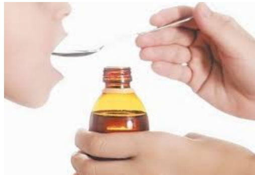
DÀ LO SCIROPPO