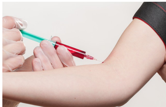
FA LA PUNTURA/PRELEVA IL SANGUE