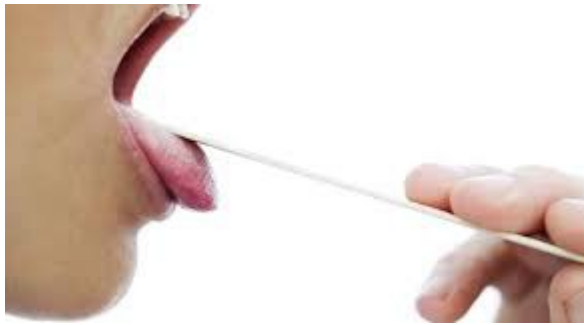
ABBASSA LA LINGUA PER VEDERE LA GOLA