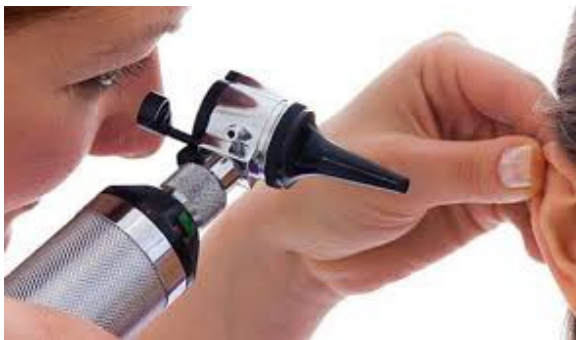
CONTROLLA DENTRO L'ORECCHIO