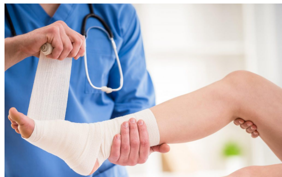
FASCIA LA FERITA