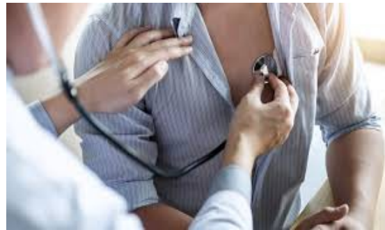
AUSCULTA I BATTITI DEL CUORE O L'ARIA NEI POLMONI