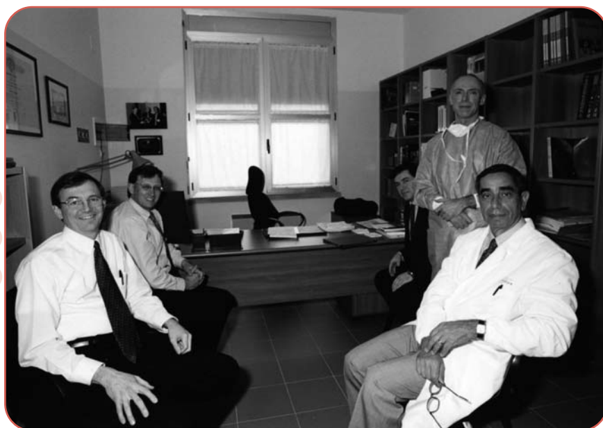
Partecipanti al Corso Avanzato di Chirurgia della Tiroide.

“Magnifico! Il corso che ho avuto il piacere di frequentare è stata l'esperienza di aggiornamento più entusiasmante ed istruttiva che ho avuto negli ultimi 10 anni.....Ciò che abbiamo imparato qui cambierà la mia pratica clinica, quella della Mayo Clinic e, quasi certamente, la pratica della tiroidologia negli Stati Uniti”