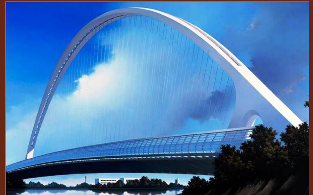
Angelo Davoli, "Calatrava Bridge", dipinto olio su tela, 2009 (cm 130 x cm 240) Collezione Fondazione Manodori Reggio Emilia

a cura della S.S.D di Immunologia Oculare